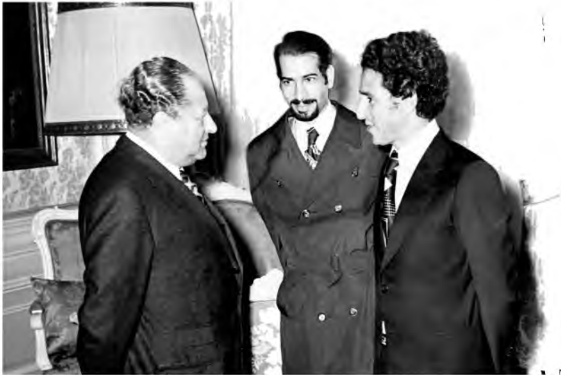
خلال زيارة عبد السلام جلود للنمسا، وجانب من لقاءه رئيس الوزراء برونو كرايسكي، النمسا، مطلع السبعينيات.